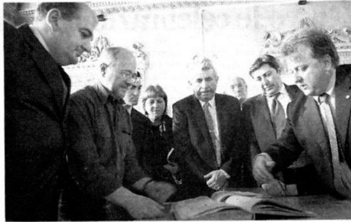
L'incontro in sala della Battaglia con la delegazione asturiana