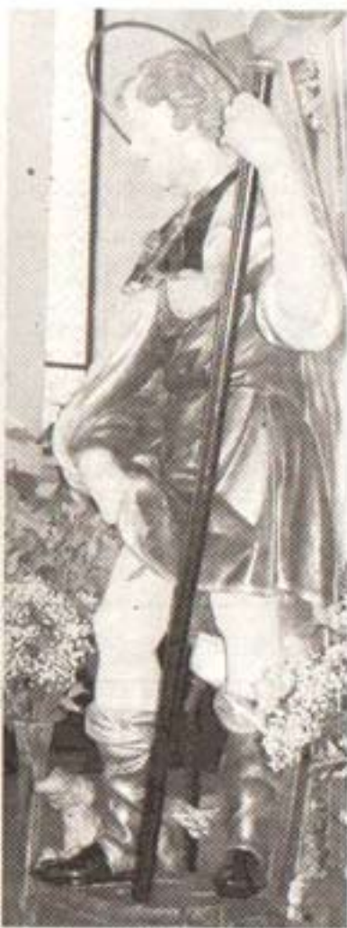
Qui a fianco, la fontana di San Rocco. Sopra la statura del santo