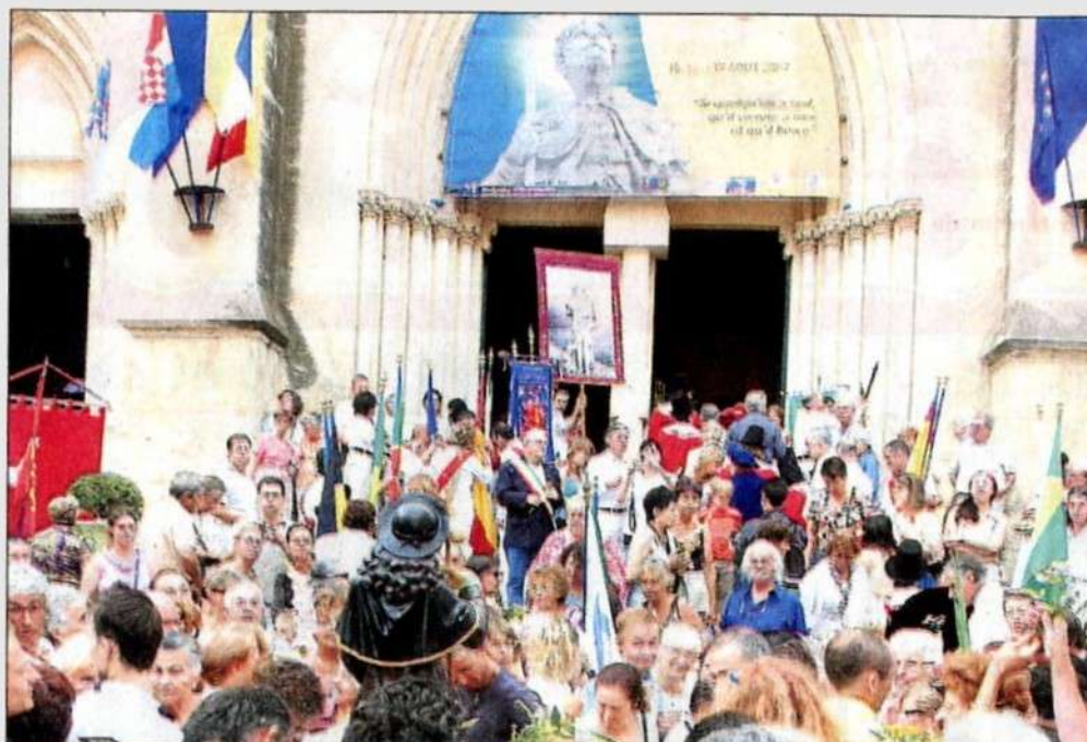
Accompagnées de nombreux pèlerins, les bonnes volontés se sont relayées pour porter la statue et les reliques du saint jusqu'au sanctuaire.