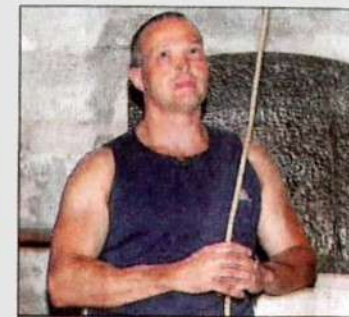
Des gros bras pour tirer la corde.