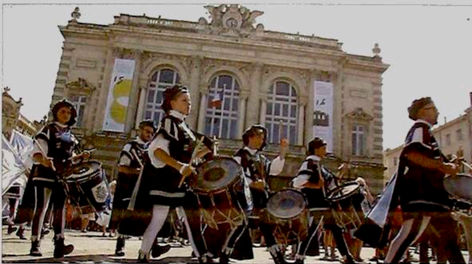
■ Les fameux Sbandieratori italiens ont enflammé la cité avec leurs trompettes et leurs lancers de drapeaux.