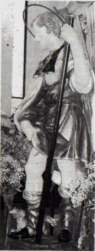
Qui a fianco, la fontana di San Rocco. Sopra la statua del santo