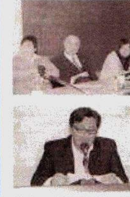
La cerimonia per la nascita di San Rocco a Sarmato, in occasione del convegno internazionale sulle Giornate di San Rocco.

L'evento ha suggellato ufficialmente l'attività del Comitato che ha sede in via Carzanga