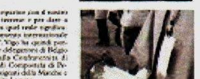
La cerimonia per la nascita di San Rocco a Sarmato, in occasione del convegno internazionale sulle Giornate di San Rocco.