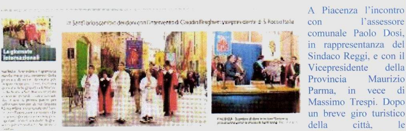
La cerimonia per la nascita di San Rocco a Sarmato, in occasione del convegno internazionale sulle Giornate di San Rocco.