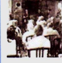
La cerimonia per la nascita di San Rocco a Sarmato, in occasione del convegno internazionale sulle Giornate di San Rocco.